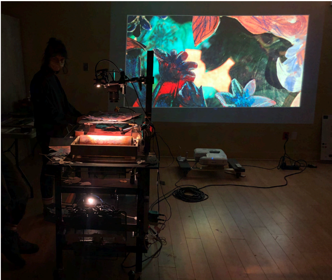
Projection sur écran à partir de la table lumineuse. Laboratoire de recherche et création (Octobre 2020).

Les résidences de création auront permis de mettre en place les éléments artistiques avec lesquels nous souhaitons travailler, c'est-à-dire la table lumineuse avec une animation « marionnettique », la projection ( mapping vidéo sur écrans fixes et mobiles) et la marionnettes en 3D à prise directe, qui s'inscrit dans un univers graphique inspiré de la bande dessinée.